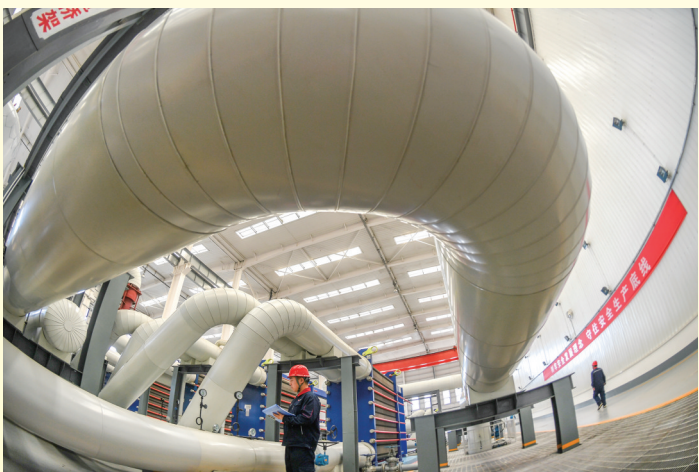
太古长输集中供热项目中继能源站