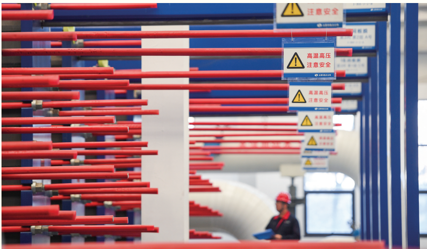
大型板式换热器巡查