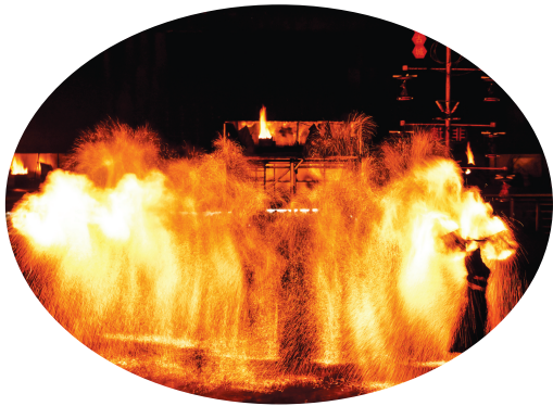
忻州古城内的“火壶”表演。