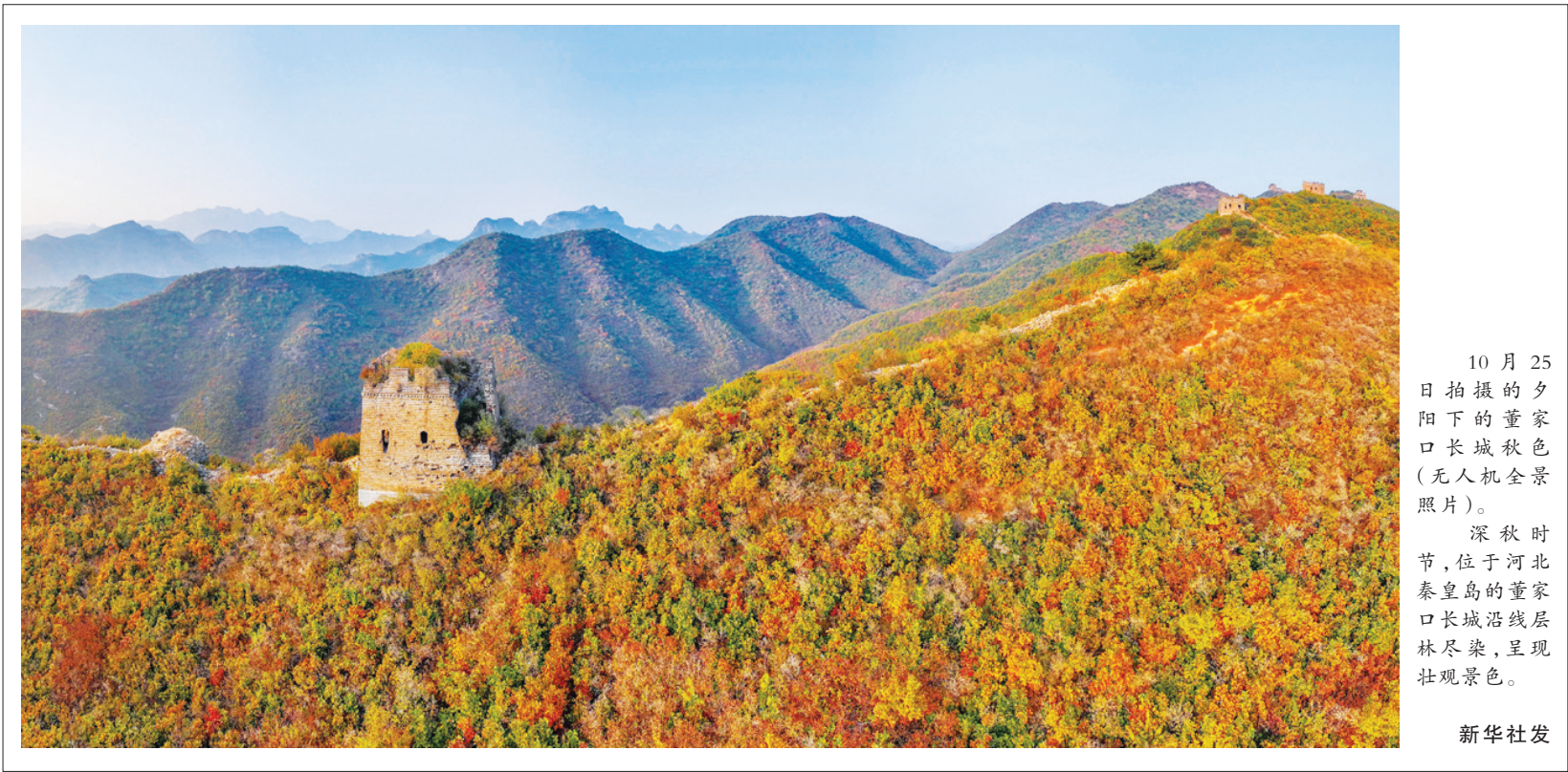
10月25日拍摄的夕阳下的董家口长城秋色(无人机全景照片)。 深秋时节,位于河北秦皇岛的董家口长城沿线层林尽染,呈现壮观景色。