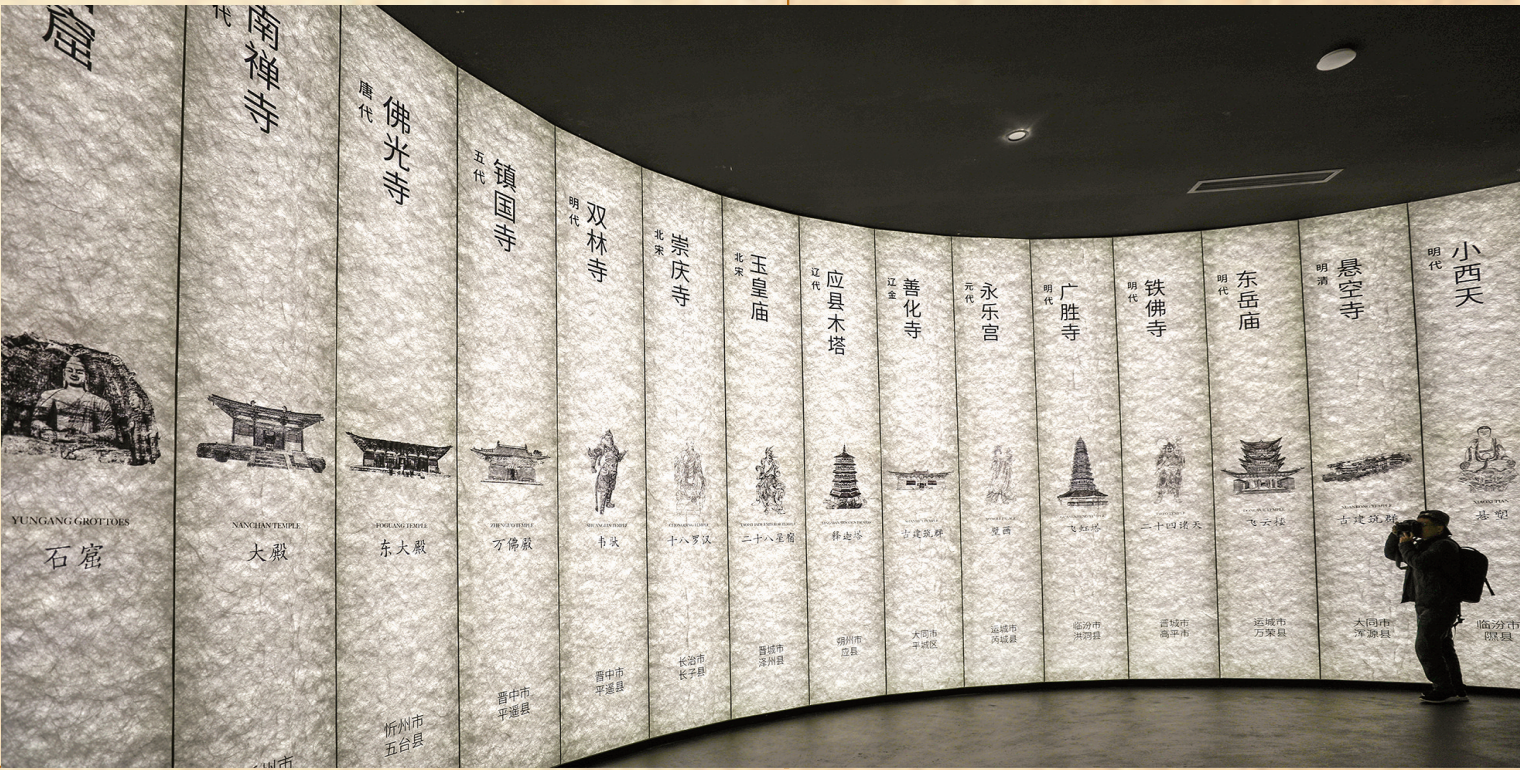
十五座古建在曲屏中铺展