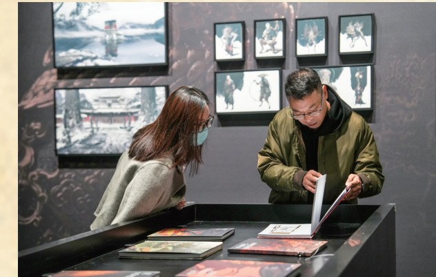
《黑神话：悟空》60+原画设定稿