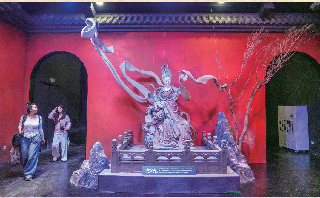
玉皇庙泥塑亢金龙复刻品