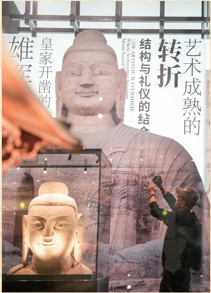
云冈石窟第20窟佛首3D高精度复制品