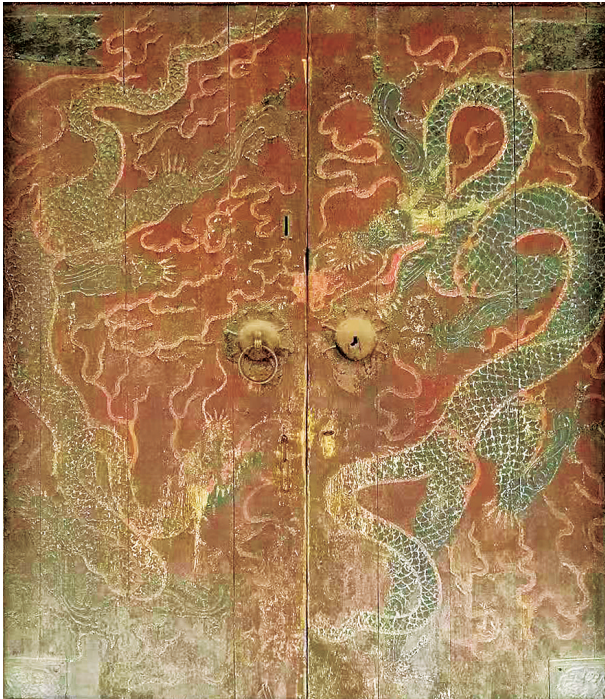
窠大夫祠的“二龙戏珠”门板彩绘