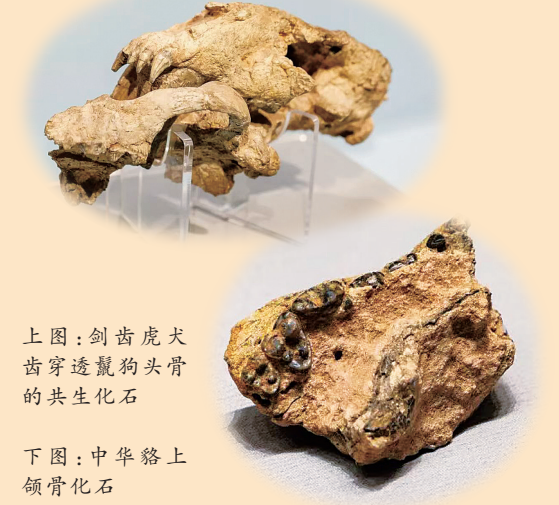
上图:剑齿虎犬齿穿透鬣狗头骨的共生化石