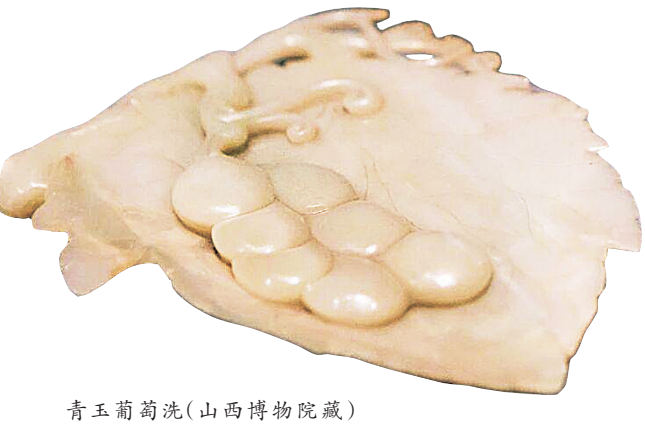
青玉葡萄洗(山西博物院藏)

10月的太原,秋意正浓。山西博物院中,静置着一件清代的青玉葡萄洗,它不仅是一件精美的文房用具,更承载着深厚的文化寓意,与这丰收时节相得益彰。 青玉葡萄洗以整块青玉雕成,器身浅敞,形如一片舒展的荷叶,内底浮雕累累葡萄缠枝纹。葡萄自汉代沿丝路传入中国,因其果实叠叠、藤蔓绵长,被赋予子孙繁盛、事业丰收的吉祥寓意。玉匠以刀代笔,将秋日丰收的意象凝于方寸之间:玉质温润含蓄,青中透碧,似秋日晴空下的深潭;葡萄纹饰层叠卷曲,仿佛能窥见文人挥毫间隙、瞥见案头果实时会心一笑的瞬间。 在明清时期,文人雅士常将此类兼具实用与雅趣的文房器具,如笔筒、镇纸、笔洗等,称为“案头清供”。青玉葡萄洗作为盛水涮笔的器具,其功能已超越单纯的实用范畴,上升为一种精神寄托和审美趣味。 古代文人追求“格物致知”,善于在日常用具中融入深意。选择葡萄纹样,既是对丰收的祈愿,也暗含了对事业有成、学识积累的期望。玉质本身的温润质感,与君子所崇尚的“温其如玉”的品德相契合,使得这样一方笔洗成为书斋中涵养性情、寄托理想的雅物。 试想,在秋日书斋中,一方玉洗、几枝菊英、满案书卷,便构成文人墨客的精神栖息天地。