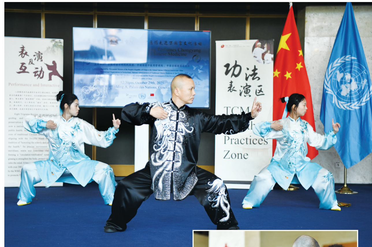
10月29日,在瑞士日内瓦“中医联世界 参香满重阳——中医药走进万国宫”文化活动中,上图为表演者进行功法表演,右图为嘉宾体验中医按摩。

多家美国媒体援引匿名美国官员的说法披露,美国“大军压境”意在迫使委内瑞拉总统马杜罗下台。美国政府一再宣称,正考虑对委内瑞拉贩毒集团展开“地面”军事行动。五角大楼的调派航母之举,加剧了外界对“美国即将入侵委内瑞拉”的担忧。 美国总统特朗普10月31日称,他尚未决定是否对委内瑞拉境内地面目标发动袭击。 分析人士认为,以目前部署在加勒比海的约1万美军规模,足以袭击委地面目标,但远不足以“入侵”“占领”委内瑞拉或对委进行地面军事干预。 美国前驻委内瑞拉大使詹姆斯·斯托里认为,特朗普政府旨在通过武力展示和威胁,促使与马杜罗关系密切的委内瑞拉精英阶层“采取行动推翻这名长期执政的左翼领导