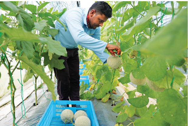
11月3日,在文莱斯里巴加湾市郊一处农业科技产业园,工作人员采摘通过中国沙培技术种植的蜜瓜。近年来,文莱政府不断深化与中国在农业领域的交流合作。在文莱斯里巴加湾市郊一处农业科技产业园,通过中国沙培技术成功种植的网纹蜜瓜近日喜获丰收,在当地市场很受欢迎。

据新华社伦敦11月3日电(记者 郭爽)受灵活的大象鼻子的启发,加拿大研究人员研发出一款微型3D生物打印机,可帮助医生在声带手术中精准输送治疗性水凝胶。患者在接受声带囊肿或增生切除手术后,常因声带瘢痕化转变而导致发声困难。研究表明,注入能模拟声带天然结构的水凝胶可有效促进愈合过程,并为新生组织提供支撑。但受限于喉部手术视野,外科医生始终难以精准投放生物材料。 据英国《自然》杂志网站报道,加拿大麦吉尔大学研发团队开发出迄今世界最小尺寸的3D打印机,配备的打印头仅2.7毫米宽,安装在一个细长的柔性机械臂末端。机械臂的运动方式类似于大象的鼻子,可通过手术用内窥镜手动控制将水凝胶精准沉积到用于手术训练的人造声带上。 目前,经过培训的操作人员使用控制器手动控制这一设备,但研究人员希望未来能对这款生物打印机编程,使其在接收到手术部位的图像后,自主遵循预设的打印路径。