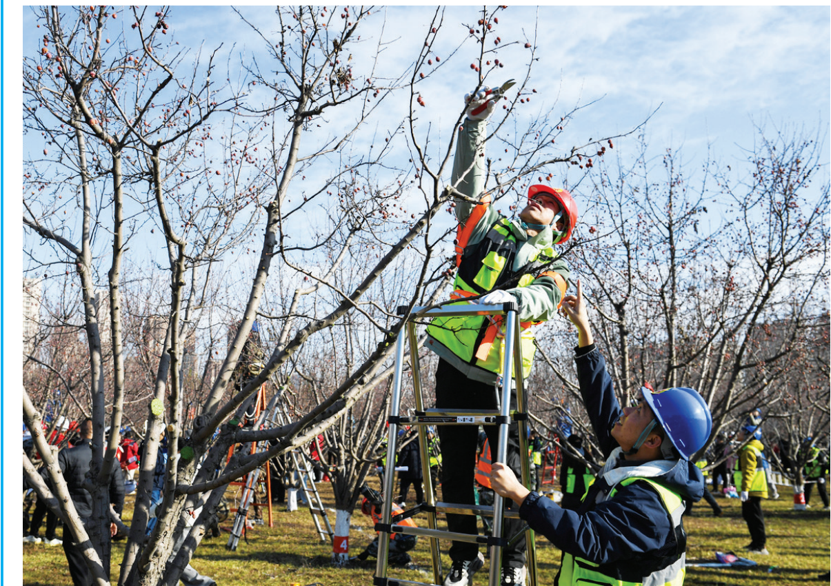
11月18日,太原市园林局树木修剪职业技能竞赛在晋阳湖公园举行,168名选手参加。竞赛评分项目包括树形树姿、枝条处理、修剪手法、安全文明操作等。

增值税法要点解析,山西知策策知识产权代理事务所(普通合伙)申报的知识产权小课堂入选。 广大中小企业可通过中国中小企业服务网(网址:www.chinasme.cn)、“企业微课”平台(网址:www.qiyeweike.com)、优质中小企业梯度培育平台(网址:zjtx.miit.gov.cn)等在线免费观看学习。中小企业主管部门依托各级中小企业公共服务机构、中小企业特色产业集群等开展公益培训服务,为中小企业提供优质专业服务。(何宝国)