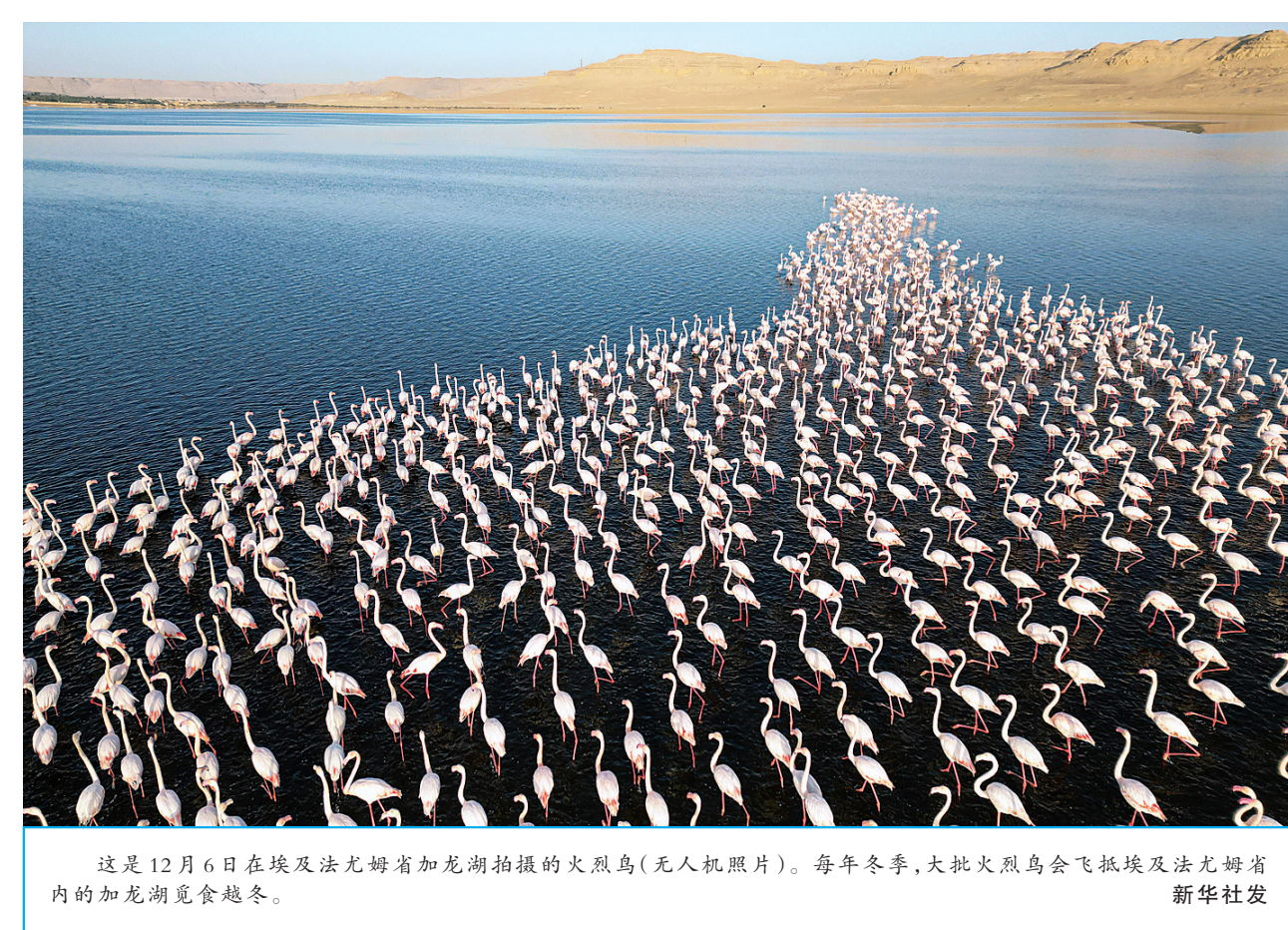
这是12月6日在埃及法尤姆省加龙湖拍摄的火烈鸟(无人机照片)。每年冬季，大批火烈鸟会飞抵埃及法尤姆省内的加龙湖觅食越冬。

贝尔格莱德中国文化中心主任张爱民表示，此次培训是中塞医药卫生领域深化合作、谋求共同发展的生动例证，也是新时代两国人民友谊的又一重要成果。