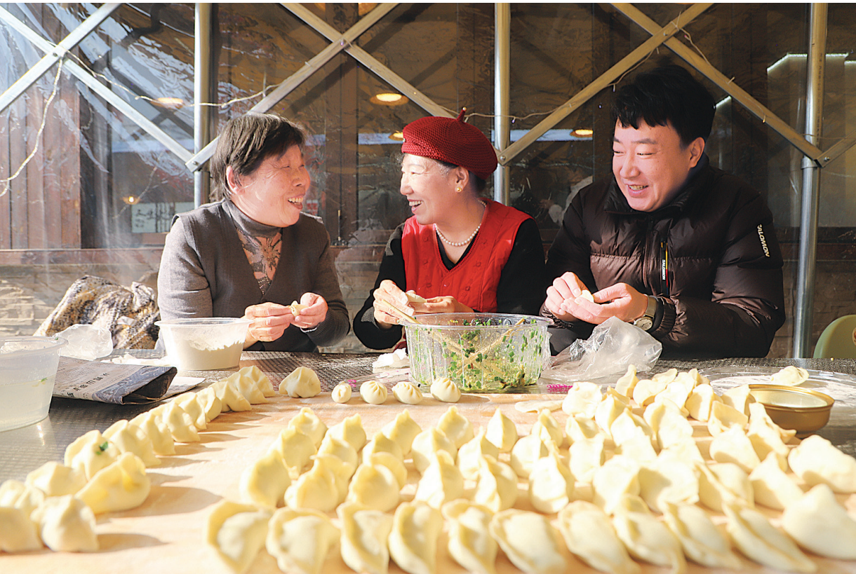
12月18日，迎泽区老军营街道举行“温暖冬至”包饺子活动。街道工作人员与辖区居民、商户一起动手包饺子迎接冬至，共叙邻里情。

乡村治理强基铸魂 我市坚持党建引领、“三治融合”，不断健全乡村治理体系，激发乡村内生动力。 组织基础全面夯实。建立三年压茬整顿机制，明确“一年集中整顿、两年巩固提升、三年复盘检视”3个步骤，“一村一策”累计整顿184个软弱涣散村党组织。实行村党组织书记星级化管理，实现“一村一名研究生”全覆盖，基层战斗堡垒更加坚固。 治理模式不断创新。推广“网格化+积分制+帮代办”模式，633个村划分网格1371个，建立党员入格、平急转换机制。农村集体经济组织全部纳入“三资”监管平台，实现线上财务核算。乡村治理示范体系建设成效显著，全市共有7个村镇被认定为全国乡村治理示范村镇，积极开展市级示范乡镇创建工作，评定市级乡村治理示范乡镇8个、示范村10个。 文明乡风浸润人心。持续开展“星级文明户”评选，累计选树典型1200余人。县级以上文明村、镇占比分别达到村、镇总数的60%和75%以上，农村精神风貌焕然一新。 “十四五”期间，我市乡村建设交出了一份亮眼成绩单，农村生产生活条件发生历史性改善，城乡融合发展迈出坚实步伐。站在新的起点上，我市将全面深入运用“千万工程”经验，以“百村示范、双百提升、全面整治”为抓手，持续推进乡村全面振兴，为再现“锦绣太原城”盛景奠定更加坚实的乡村基础，让宜居宜业和美乡村成为太原高质量发展的亮丽底色。 记者 周皓