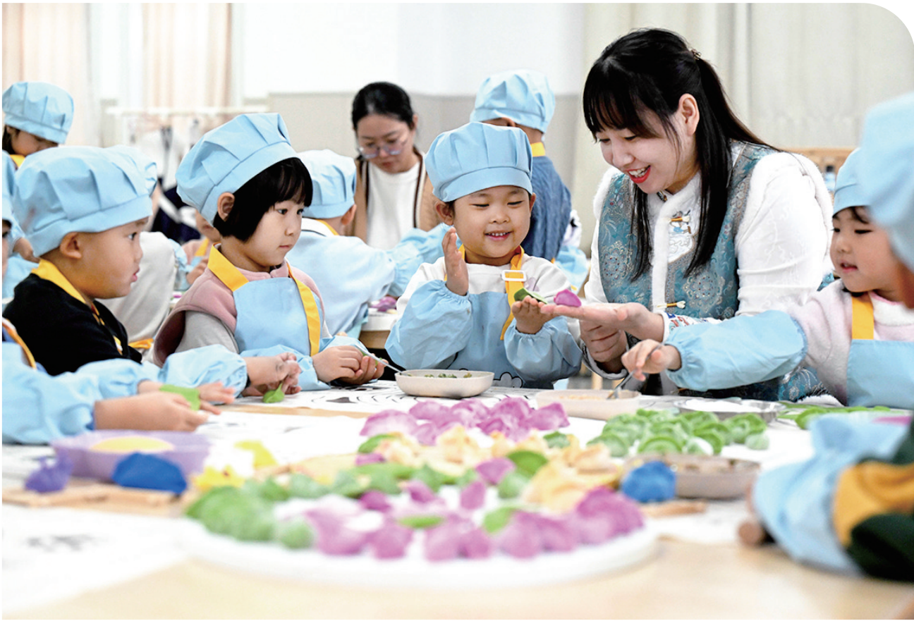
12月19日,在河北省石家庄市新华区第一幼儿园,老师指导小朋友们包饺子。临近冬至,各地开展包饺子迎冬至活动。