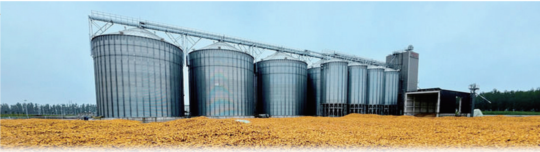
山东省德州市平原县恩城镇为农服务中心(2025年10月9日报)。