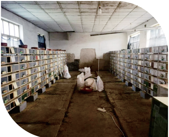
图为犯罪团伙育肥黄胸鸮窝点。