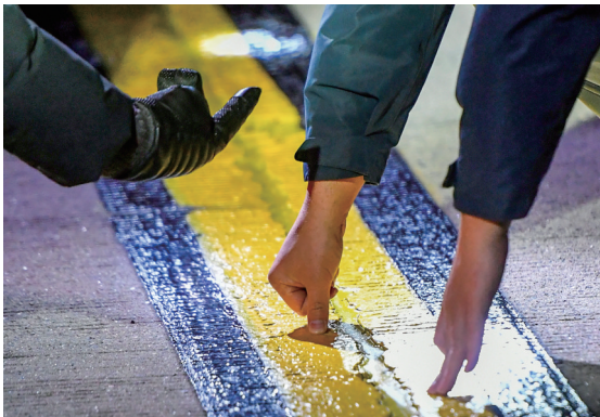
跑道标志线凝固度检测