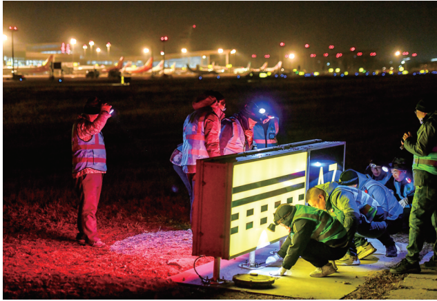
拆除滑行引导标志牌