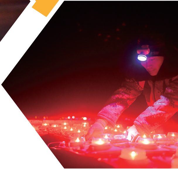
安装不适用地区灯