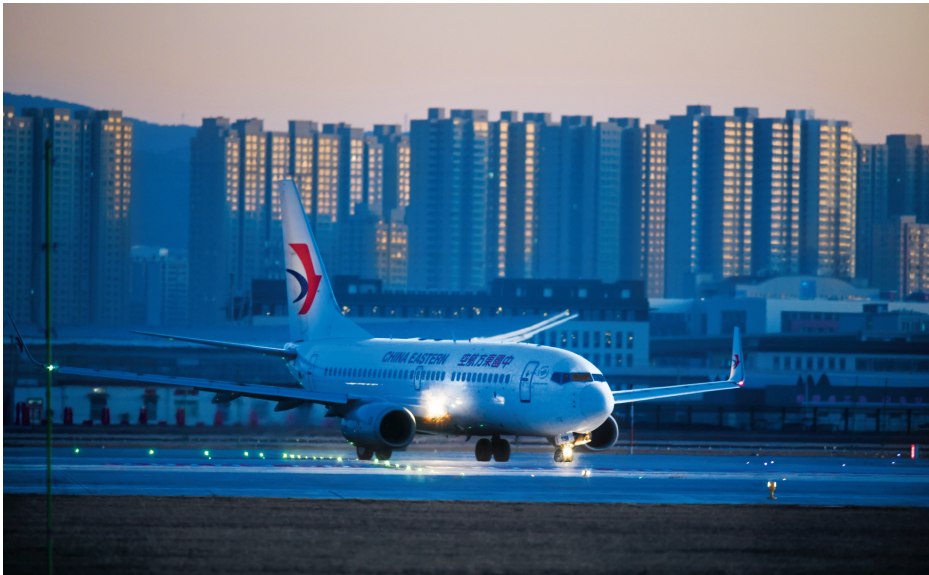
即将起飞的航班从一跑道转场至二跑道