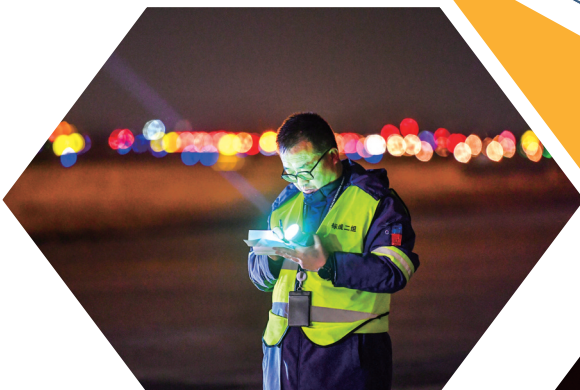
记录跑道倒改工作进度