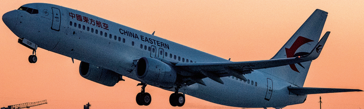
2025年12月25日7时03分, MU6937航班平稳起飞。