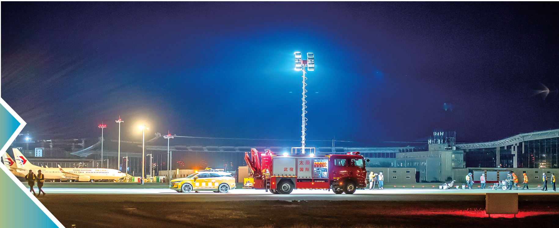
各部门密切配合保障转场工作