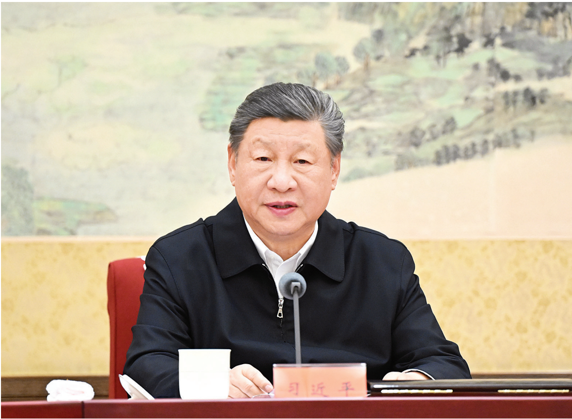
12月25日至26日，中共中央政治局召开民主生活会，中共中央总书记习近平主持会议并发表重要讲话。