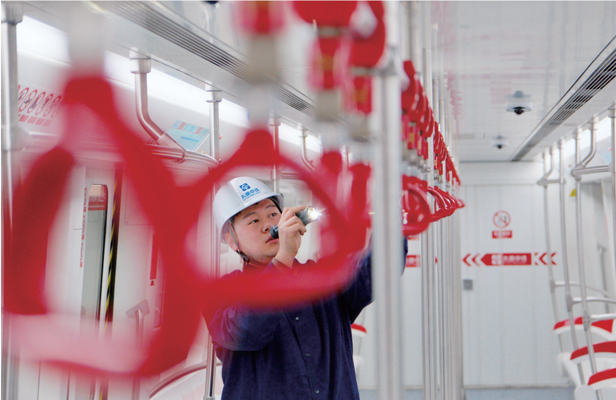
2月7日,中铁电气化局太原中铁轨道公司贾家寨车辆段停列车列检修库内,工作人员在对列车进行检修、维护、全方位排障,确保春运期间列车运行安全。