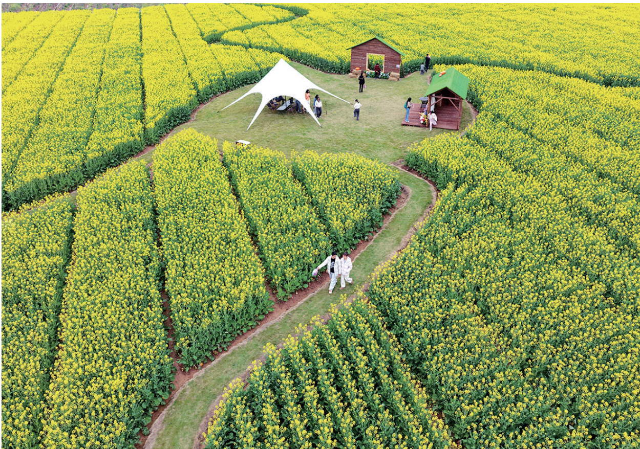
3月21日，人们在浙江省东阳市南马镇花园村天香湾内赏花游玩(无人机照片)。春暖花开、万物复苏，正是踏青赏景好时节。人们走出家门，乐享春日时光。