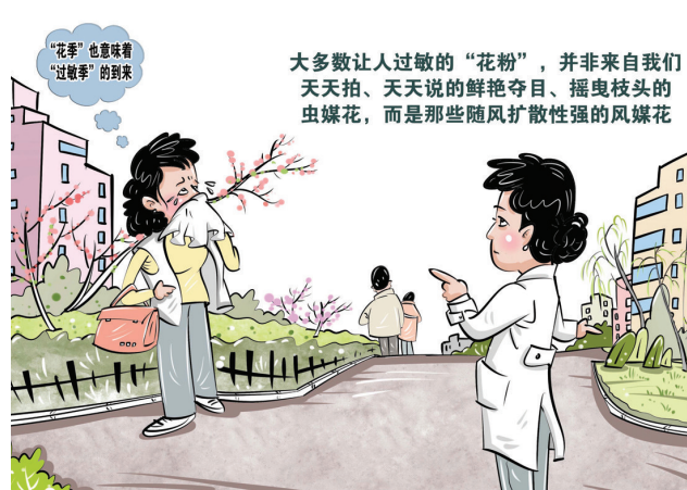
花粉过敏科普 新华社发 商海春 作

简单地说，这种方法就是让患者反复接触微量的花粉提取物（疫苗），让身体逐渐适应，最终达到“和平共处”的状态。这就像是给身体做脱敏训练，让免疫系统不再对花粉反应过度。