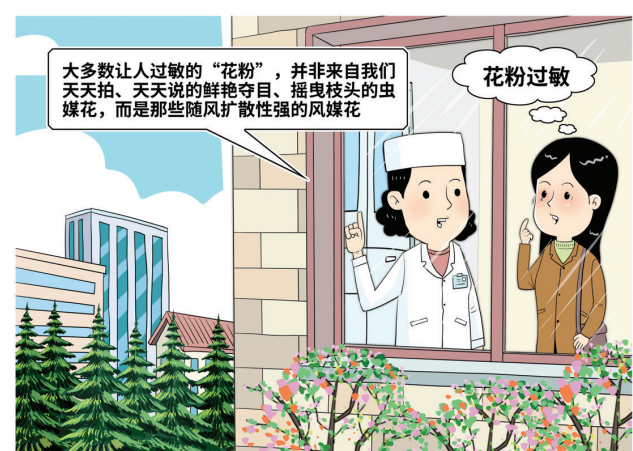
此“花”非彼“花” 新华社发 朱慧卿 作