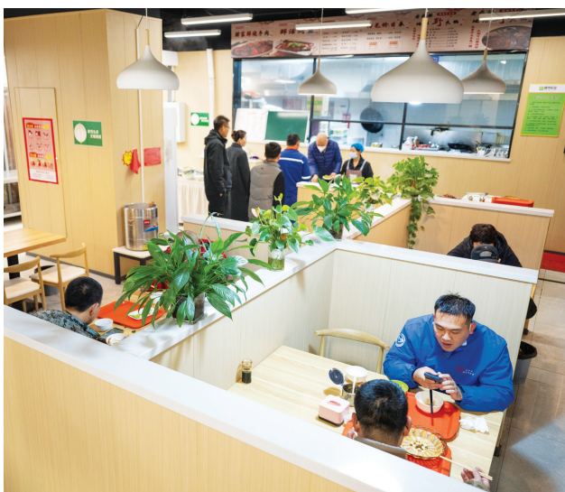
上图：这是2026年3月18日拍摄的雄安新区启动区景色（无人机照片）。