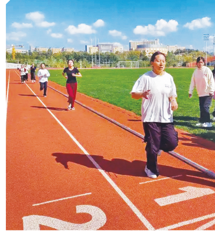
云南大学学生在进行体测。

我突然想起王昆来的另一句话:“主动锻炼,从来不是被逼出来的,而是被点燃的。而教育者的责任,就是点燃那团火。” 新华社记者 岳冉冉(新华社昆明3月31日电)