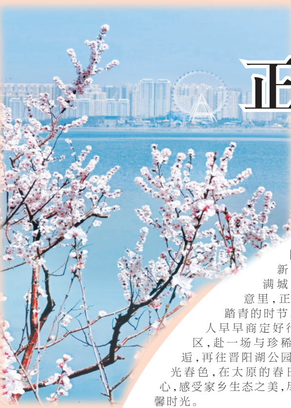
晋阳湖桃花岛风景

3月的太原，风儿轻柔，阳光明媚，枝头抽新芽，陌上草青青，满城都浸在淡淡的春意里，正是一年中最适合踏青的时节。恰逢周末，一家人早早商定好行程，先赴汾河景区，赴一场与珍稀候鸟白琵鹭的邂逅，再往晋阳湖公园，赏湖畔桃花、湖光春色。在太原的春日盛景里，放松心情，感受家乡生态之美，尽享阖家相伴的温馨时光。