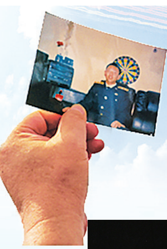
向蓝天，她大声说：“王伟，你和战友们又见面了！” 安门广场时，“海空卫士”王伟的妻子阮国琴在观礼台上把王伟的照片争胜利八十年大会在北京天安门广场隆重举行。当空中梯队飞过天安门时，阮国琴泪流满面，她大声说：“王伟，你和战友们又见面了！” ▲二〇二五年九月三日，纪念中国人民抗日战争暨世界反法西斯战争