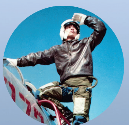
王伟与战机合影(资料照片)。