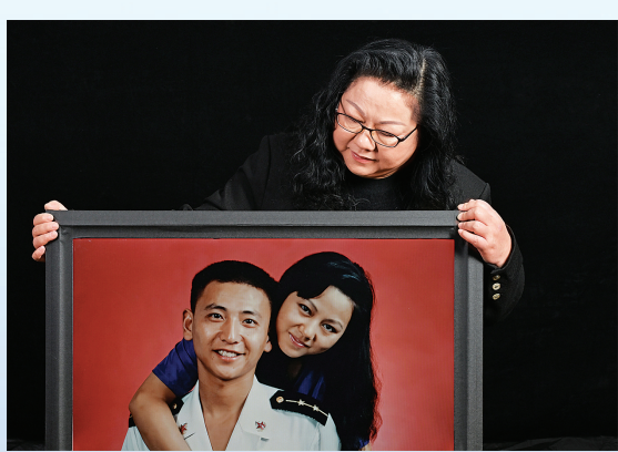
王伟的妻子阮国琴环抱着与丈夫的合影，这张照片是王伟军校毕业后首次探亲时拍摄的(2026年1月4日摄)。

“呼叫81192，请你立即返航！” 4月1日，是一个刻在民族记忆深处的日子。25年前的今天，王伟驾驶81192号战机升空迎敌，以生命为笔，在万里长空写下忠诚，将青春定格在33岁的碧海长空。 追思不仅是为了缅怀，更是为了铭记。清明前夕，我们走近王伟、张超、肖思远三位烈士的亲人，透过一张张定格青春的军装照，一件件承载深情的纪念品，见证英雄身后的思念与坚守。 照片里的他们永远年轻，笑容清澈，目光坚定，仿佛从未走远。他们是妻子相依相伴的丈夫、是温情守护女儿的父亲，是母亲牵挂至深的儿子，他们是家庭最温暖的依靠，却在使命召唤时毅然以身许国，把生命献给了万里长空、苍茫碧海与巍巍边疆，将最鲜活青春，永远留在岗位。 “人民英雄”张超说：“谁不怕死呢？但我们这些人，就是时刻准备着要为祖国牺牲的！” 2016年4月27日，从战机报警到跳伞离机的4.4秒里，张超全力推杆到底、挽救飞机，因推迟跳伞坠地重伤，29岁的青春化作永不熄灭的航灯。 新时代卫国戍边英雄肖思远在日记中写道：“我们就是祖国的界碑，脚下的每一寸土地，