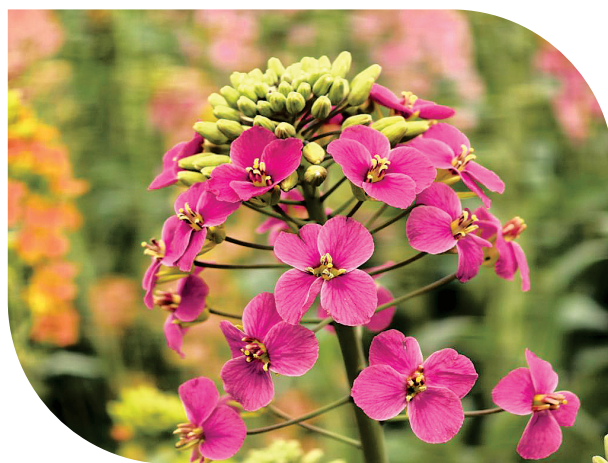
这是今年新开的“绛玫红”色油菜花(2026年3月12日摄)。

我们的彩色油菜花最南种到了三亚，最北种到了牡丹江，海拔最高种到了拉萨，最低种到了涠洲岛。目前，我们