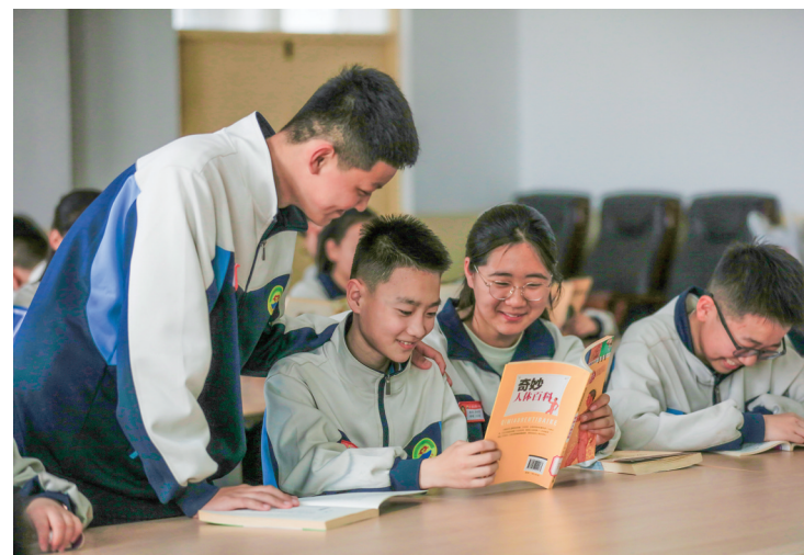
同窗共读(小店区第六中学图书馆)