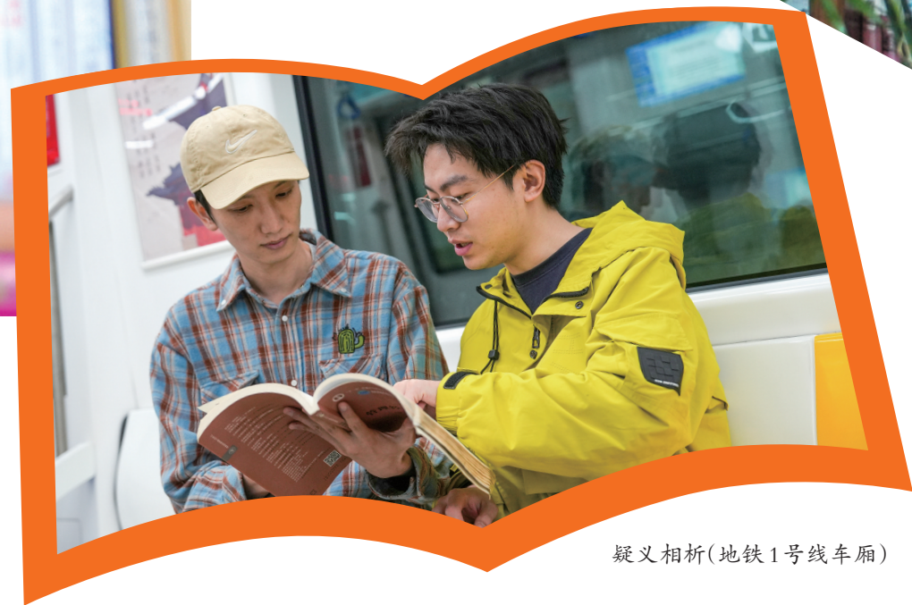
疑义相析(地铁1号线车厢)