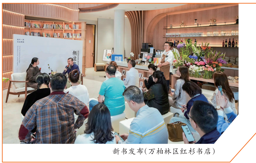
新书发布(万柏林区红杉书店)