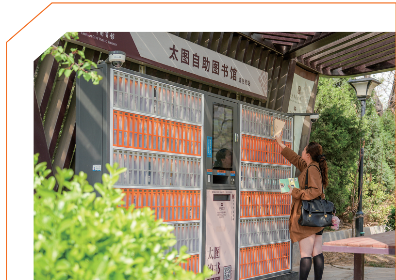
借阅图书(城坊街街心花园太原自助图书馆)

暮春时节，并州大地最美的时光里，书香与花香交织，沿着汾河两岸、老街深巷、公园地铁……温柔地浸润着这座古城的每一寸肌理。