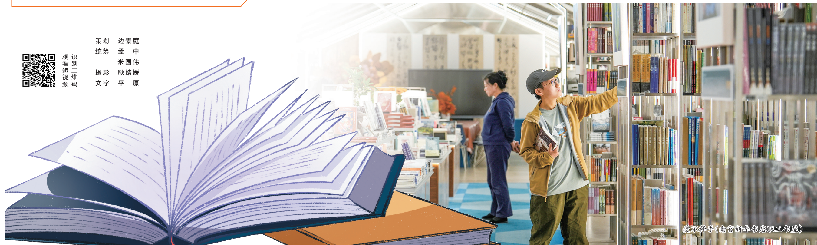
爱不释手(南宫新华书店职工书屋)