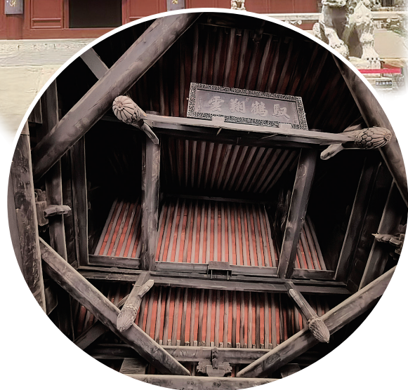
上图:吕祖殿 下图:移柱造技法梁架

殿内采用移柱造技法,减少了内柱数量,扩大了祭祀空间,梁架简洁、榫卯精密,无一颗钉子却屹立400年不倒,结合抹角梁与垂柱的协同作用,即便历经风雨,仍保持稳固,是中国古建“以柔克刚”哲学的实物见证。抬头仰望梁架,榫卯咬合的痕迹清晰可见,每一处衔接都严丝合缝,驼峰、丁华抹额拱等构件的雕刻简约而精致,