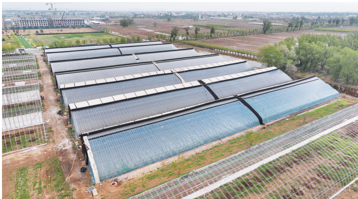
4月28日,清徐县成子村水蓄热日光节能温室项目雏形显现,76座温室已完成主体建设,剩余9座正有序推进保温通风系统安装、防虫网铺设等核心施工环节。这是清徐县首次建设的日光节能类温室,相较传统温室具有占地小、不破坏耕地、投入少、生产效率高等特点。