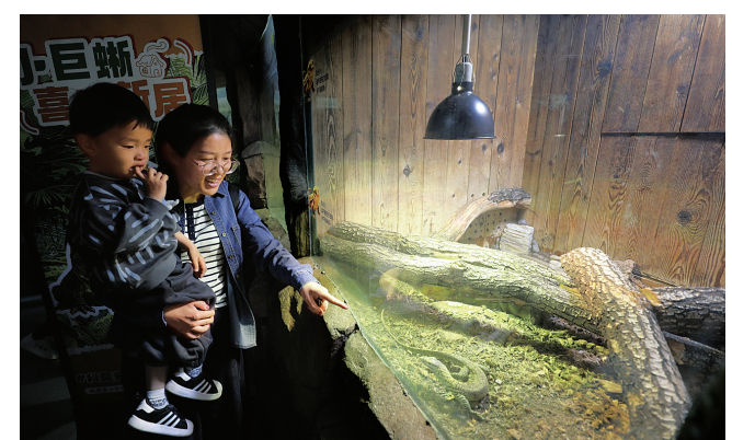
5月1日，全国首例孤雌繁殖的科莫多巨蜥宝宝在太原动物园正式与游客见面。图为5月3日，游客在近距离观赏科莫多巨蜥幼蜥。