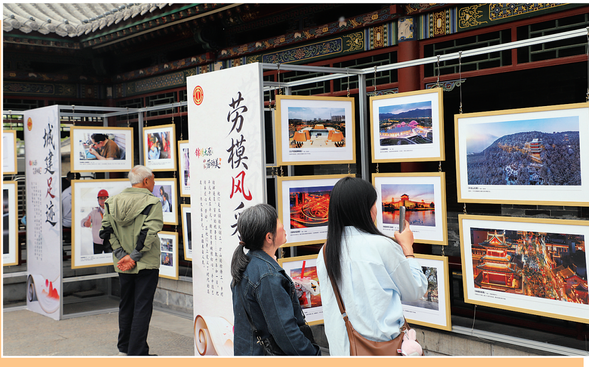
为庆祝“五一”国际劳动节，太原市总工会在钟楼街举办“锦绣太原·劳动美”主题摄影展。图为5月3日，市民观展。