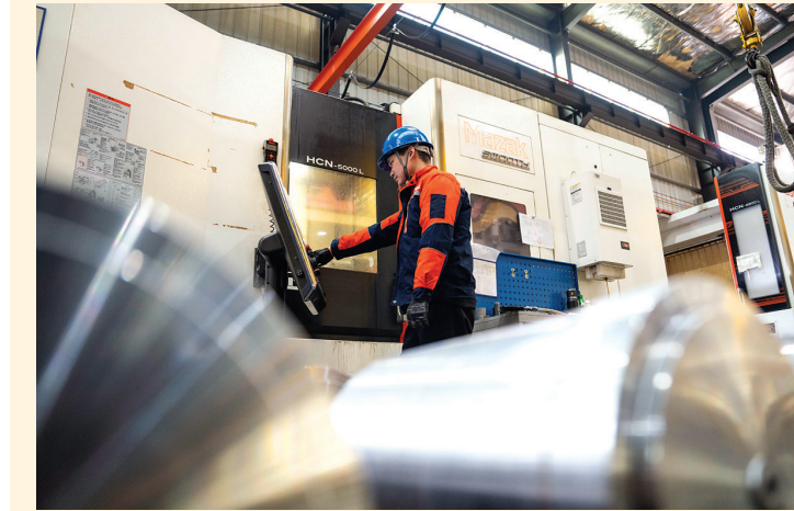
▲2026年1月14日,在位于湖南常德高新区的湖南佳鸿机械股份有限公司,工人在生产风力发电机滑动轴承,赶制海外订单产品。