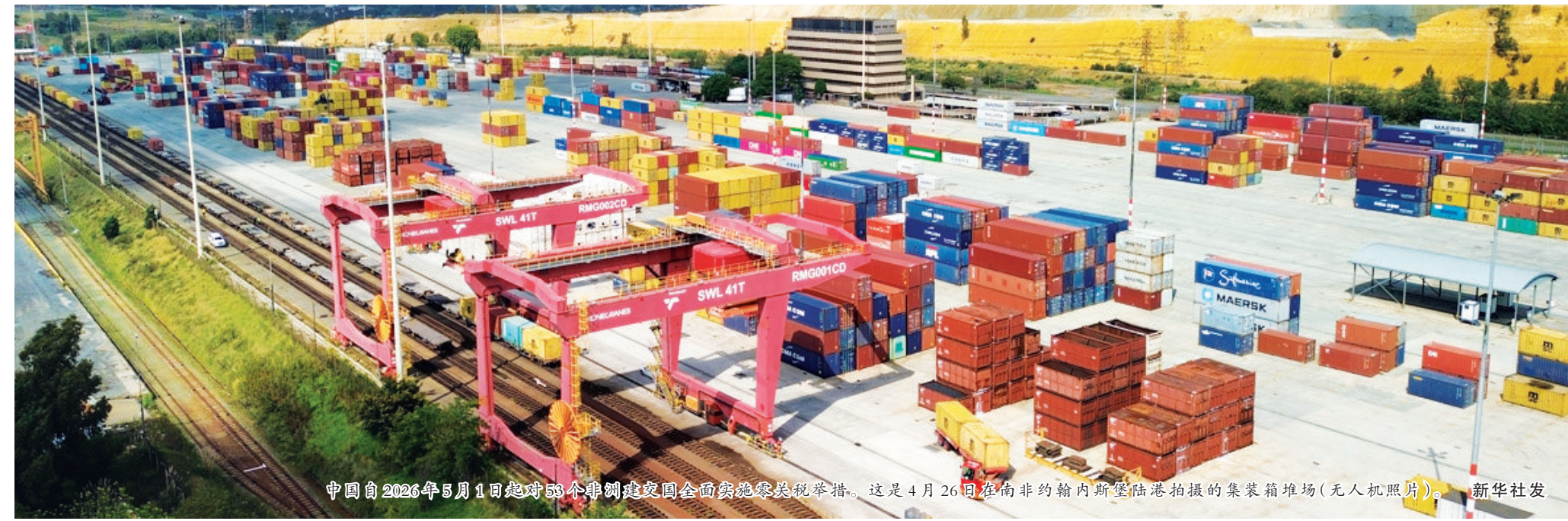
中国自2026年5月1日起对53个非洲建交国全面实施零关税举措。这是4月26日在南非约翰内斯堡陆港拍摄的集装箱堆场(无人机照片)。