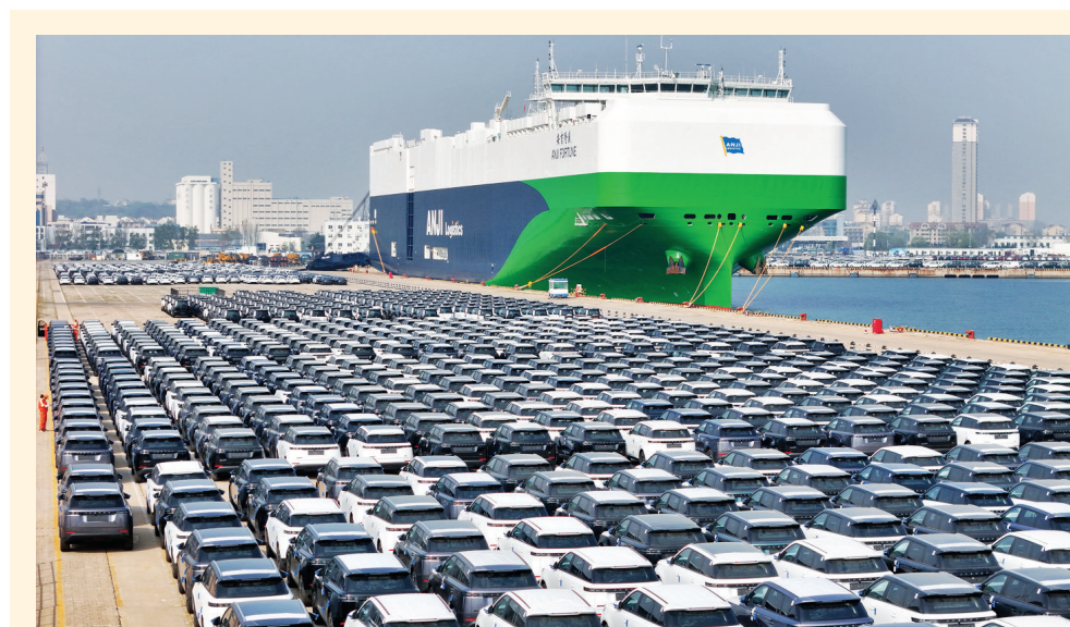
▲2026年4月14日,国产汽车在山东港口烟台港等待装船出口(无人机照片)。

尤为值得注意的是,中非贸易规模创历史新高,前4个月我国对非洲国家进出口8853.4亿元,同比增长19.4%,历史同期首次突破8000亿元。其中,自非洲进口增长11.2%,已连续8个月保持同比增长。