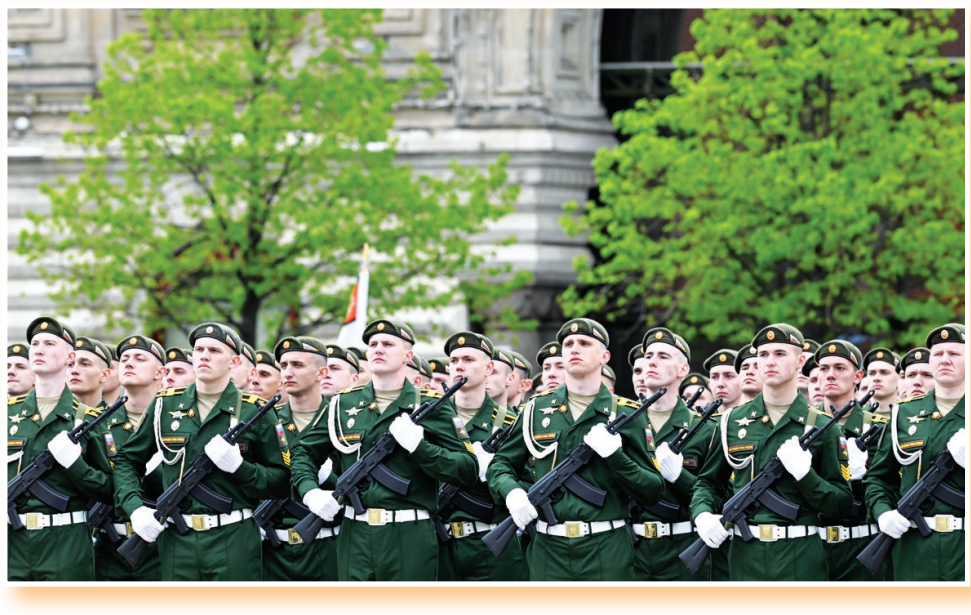
5月9日,在俄罗斯首都莫斯科,军人参加纪念卫国战争胜利81周年阅兵式。