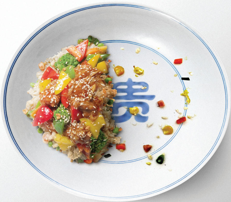
俭以养德 杜绝穷奢