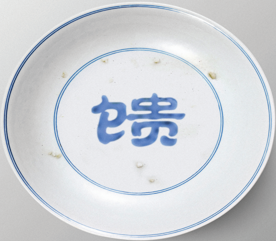
大地馈赠 拒绝浪费