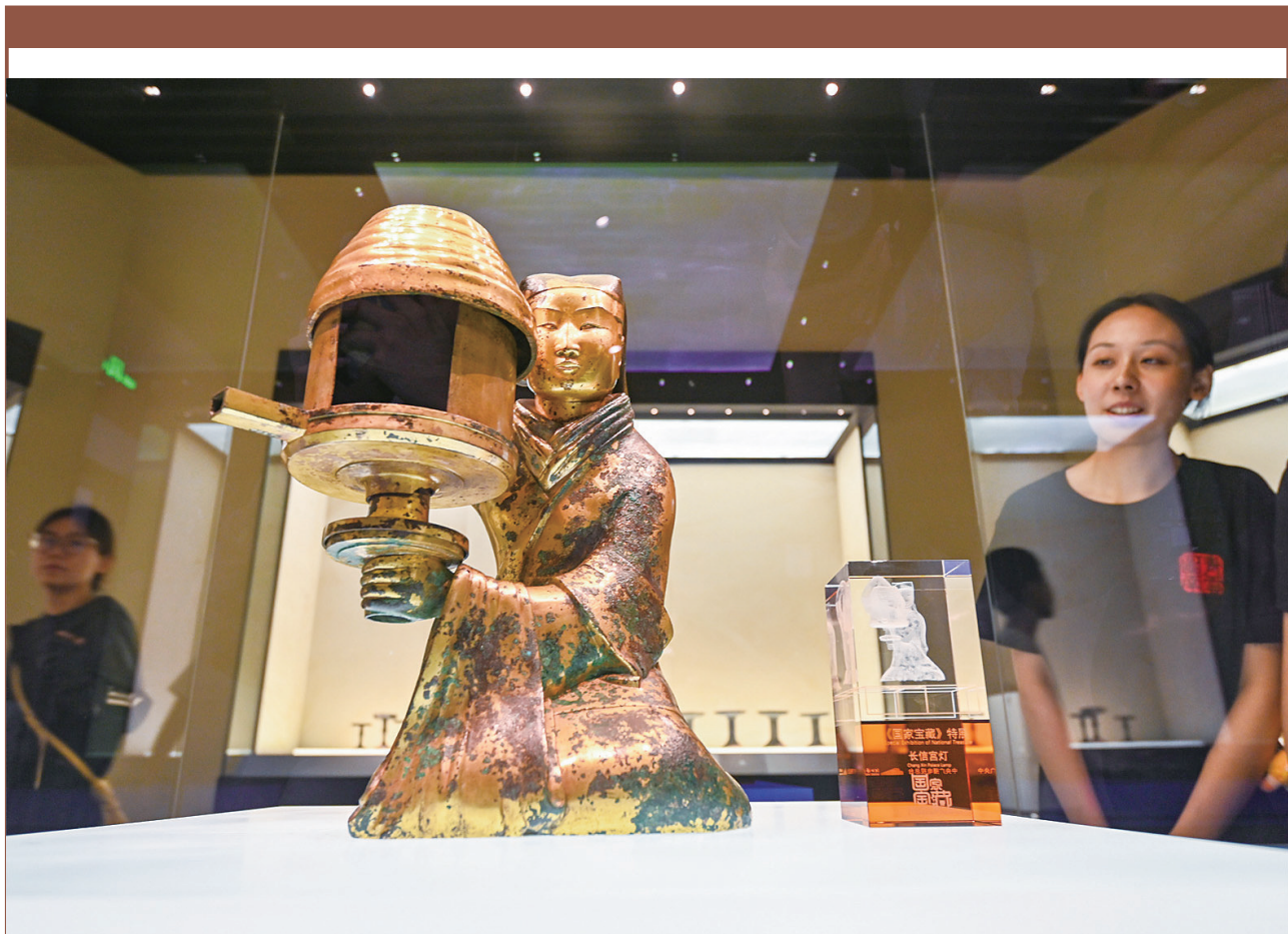
▲5月16日，游人在位于石家庄的河北博物院展厅欣赏国宝文物长信宫灯。