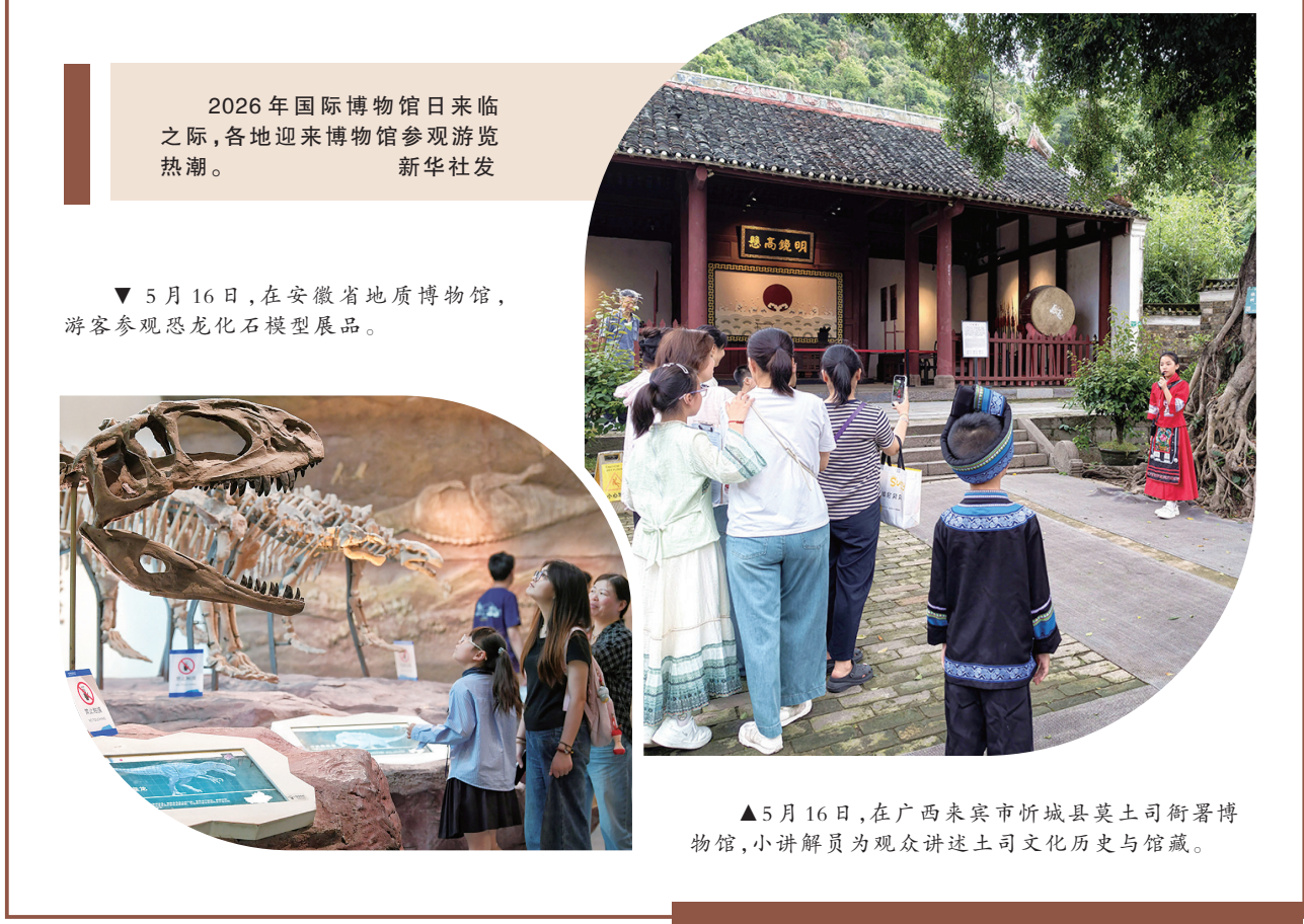
2026年国际博物馆日来临之际，各地迎来博物馆参观游览热潮。