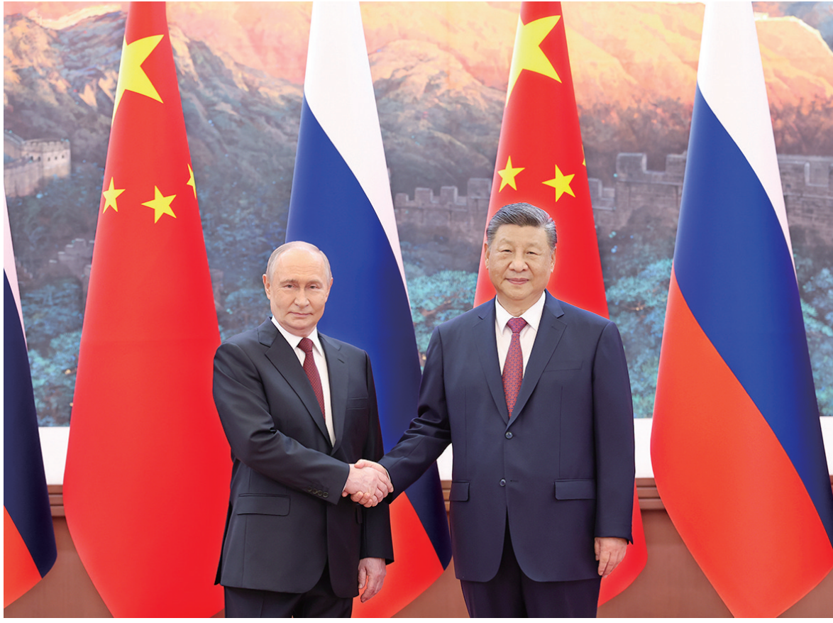
5月20日上午,国家主席习近平在北京人民大会堂同来华进行国事访问的俄罗斯总统普京举行会谈。