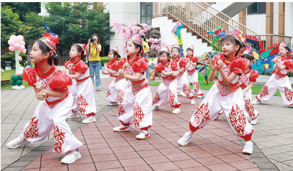
5月29日，在湖北省武汉市，湖北省省直机关第二幼儿园的小朋友在表演舞蹈。“六一”国际儿童节将至，孩子们欢欢喜喜迎接自己的节日。

方案提出继续巩固提升第一批88条(个)母亲河(湖)复苏成效。保障重点河湖生态安全，持续实现西辽河、永定河、京杭大运河全线水流贯通，保障白洋淀生态水位以及维持其他华北地区河湖生态环境复苏成效，继续加强黑河、石羊河等生态调水，巩固西北内陆河生态治理成效。