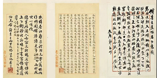
《雨中花鸭图》和六人题诗(资料图片)