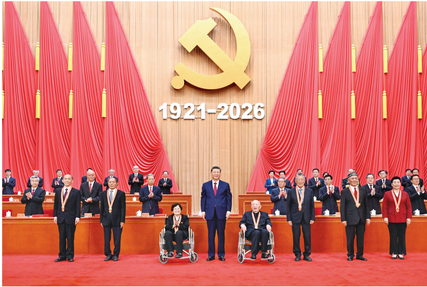
7月1日上午，庆祝中国共产党成立105周年大会在北京人民大会堂隆重举行。中共中央总书记、国家主席、中央军委主席习近平向“七一勋章”获得者颁授勋章。

新华社北京7月1日电 庆祝中国共产党成立105周年大会7月1日上午在北京人民大会堂隆重举行。中共中央总书记、国家主席、中央军委主席习近平向“七一勋章”获得者颁授勋章并发表重要讲话。他强调，105年来，我们党始终坚守为中国人民谋幸福、为中华民族谋复兴的初心使命，在不懈奋斗中创造了彪炳史册的伟大成就。新征程上，全党同志要坚定信心、接续奋斗，不断创造无愧于时代和人民