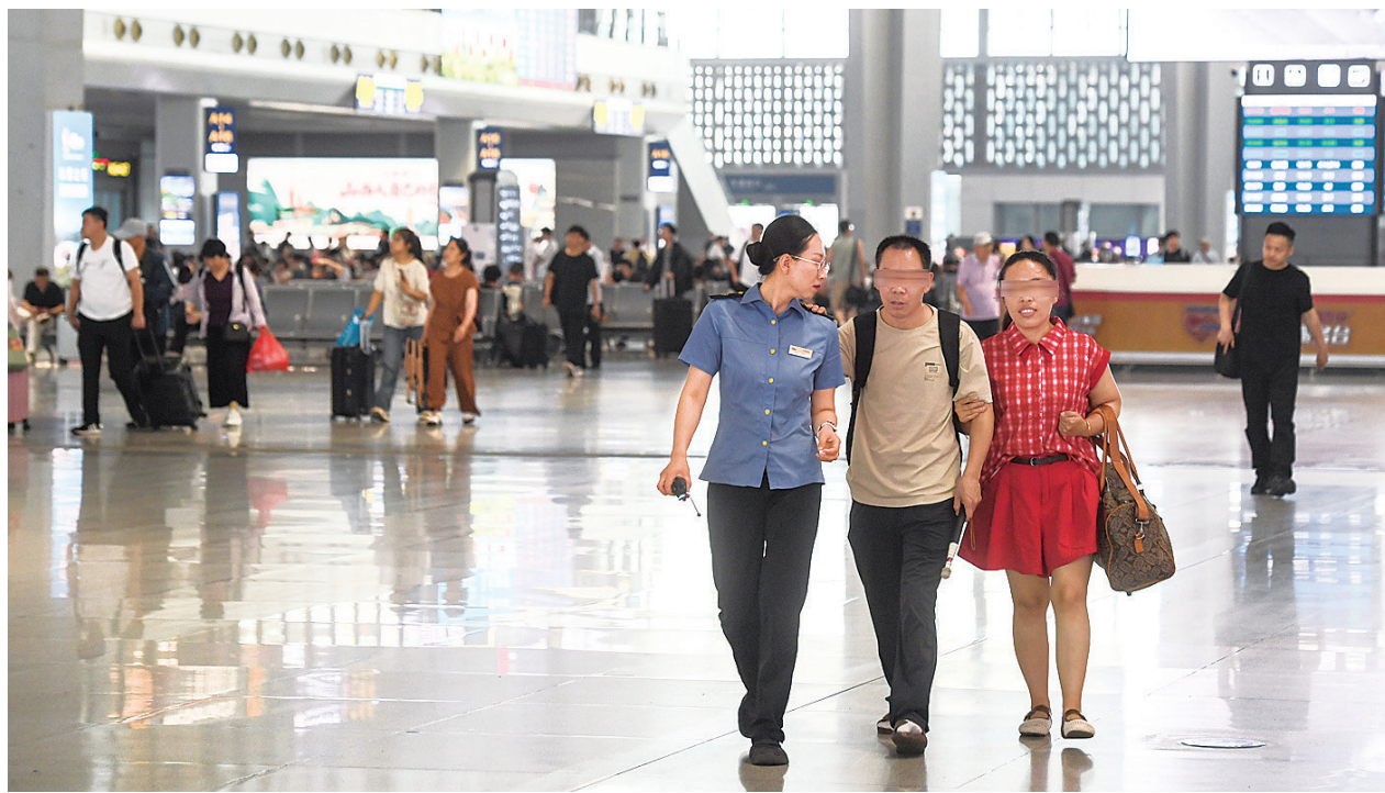
随着暑运开启，旅游流、学生流、探亲流叠加，太原南站迎来客流高峰。该站在运输组织、品牌服务、设备保障等方面全力以赴，确保旅客平安出行。图为7月6日，太原南站工作人员帮助视障旅客乘车。