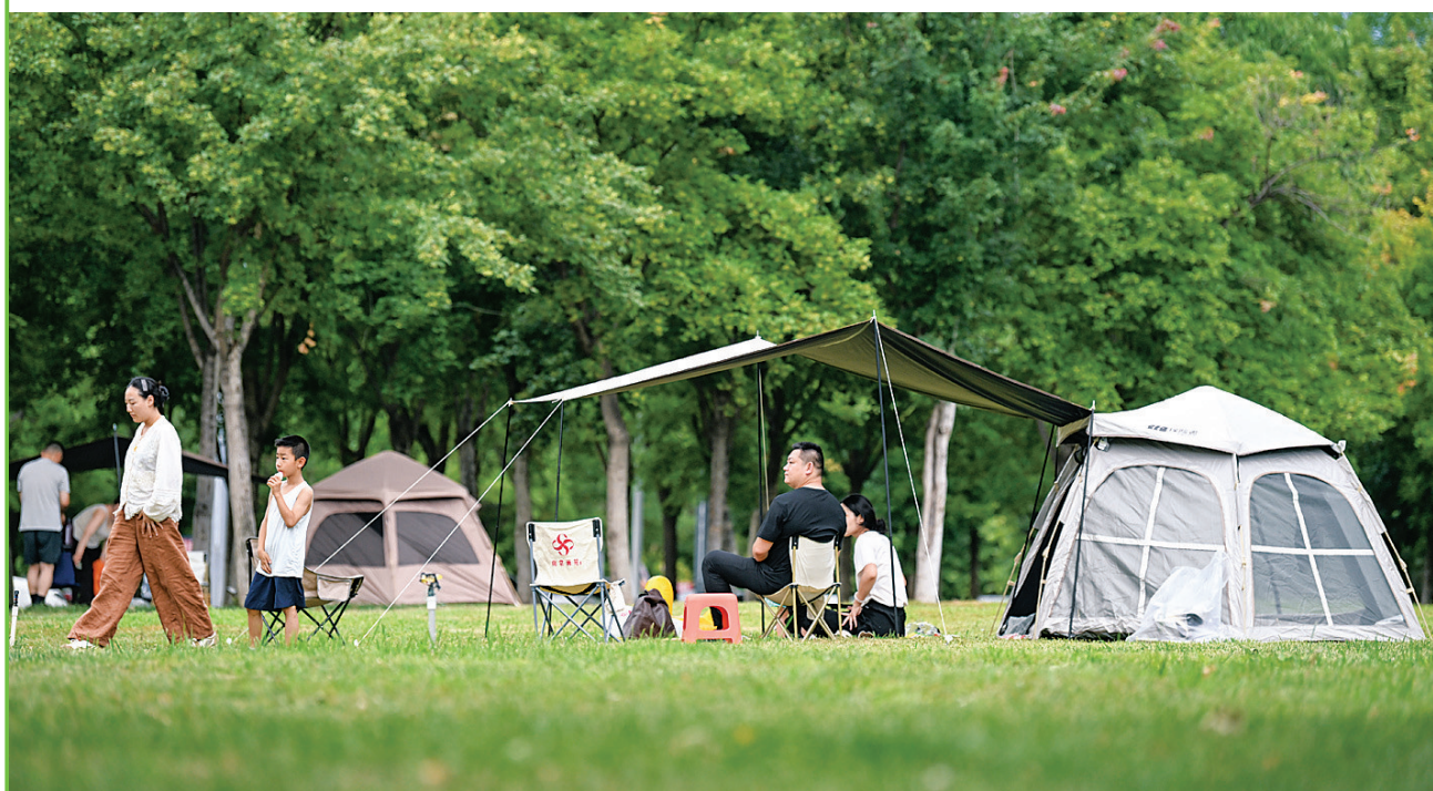
7月5日,人们在河北省石家庄市滹沱河生态区(城区段)露营休闲。

业内人士认为,今年的夏日经济呈现出业态融合化、消费品质化、场景多元化等鲜明特征,户外潮流消费持续走高,夜间消费延时扩容,文体旅深度融合打造消费新闭环,成为我国经济内生动力不断增强的生动缩影。