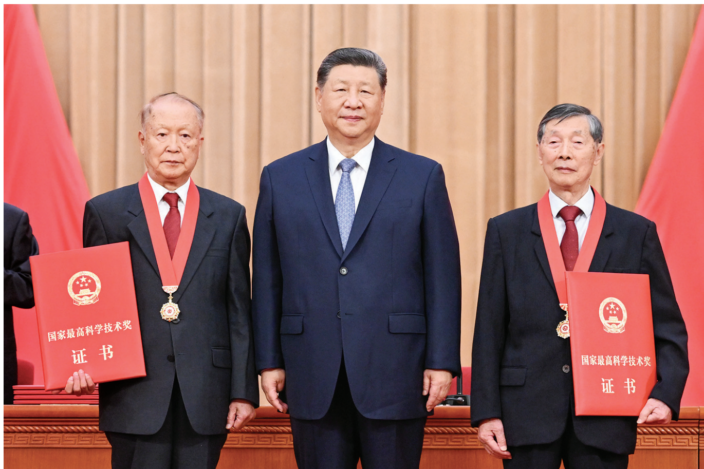
7月8日上午，国家科学技术奖励大会、中国科学院第二十二次院士大会和中国工程院第十八次院士大会、中国科学技术协会第十一次全国代表大会在北京人民大会堂隆重召开。中共中央总书记、国家主席、中央军委主席习近平向获得2025年度国家最高科学技术奖的中国科学院物理研究所陈立泉院士(右)和中国电子科技集团第十四研究所贾德院士(左)颁奖。

新华社北京7月8日电 国家科学技术奖励大会、中国科学院第二十二次院士大会和中国工程院第十八次院士大会、中国科学技术协会第十一次全国代表大会8日上午在人民大会堂隆重召开。中共中央总书记、国家主席、中央军委主席习近平出席大会，为国家最高科学技术奖获得者等颁奖并发表重要讲话。他强调，“十五五”时期是科技强国建设的关键攻坚期。必须抓住历史机遇，迎接时代挑战，加快推进高