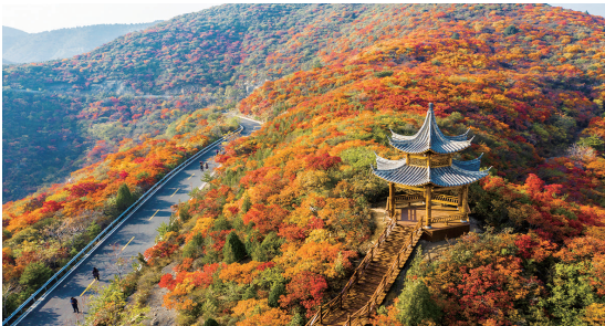
亭亭玉立红叶中