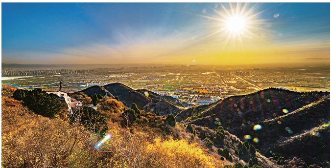
阳光普照石窟

流丹似火的红叶、历史悠久的石窟，完美地于龙山融合，成为太原人骄傲的文化“名片”。 1月12日，由太原市文物局、山西省摄影家协会和晋源区政府主办，“山西晚报·文博山西”、太原日报社视觉策划中心协办，太原市龙山文物保管所承办的“兼容并蓄、生态龙山”第二届摄影大赛及短视频大赛完美收官。 此次大赛征稿时间为2020年9月10日至11月30日。在两个多月的时间里，征集到我市百余位摄影爱好者拍摄的1300余幅作品。作品从不同角度展现了龙山之美，以及其“兼容并蓄、海纳百川”的内涵，使龙山的文物真正“活”起来，进一步提高了我市文化研究能力和文化影响力。 本报选登部分获奖作品，以飨读者。