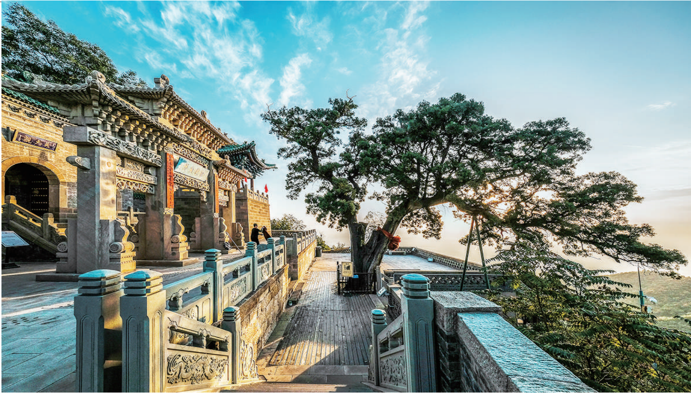
晨光映龙山

流丹似火的红叶、历史悠久的石窟，完美地于龙山融合，成为太原人骄傲的文化“名片”。 1月12日，由太原市文物局、山西省摄影家协会和晋源区政府主办，“山西晚报·文博山西”、太原日报社视觉策划中心协办，太原市龙山文物保管所承办的“兼容并蓄、生态龙山”第二届摄影大赛及短视频大赛完美收官。 此次大赛征稿时间为2020年9月10日至11月30日。在两个多月的时间里，征集到我市百余位摄影爱好者拍摄的1300余幅作品。作品从不同角度展现了龙山之美，以及其“兼容并蓄、海纳百川”的内涵，使龙山的文物真正“活”起来，进一步提高了我市文化研究能力和文化影响力。 本报选登部分获奖作品，以飨读者。