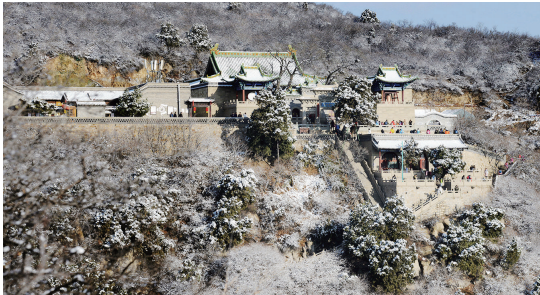
龙山深处有人家