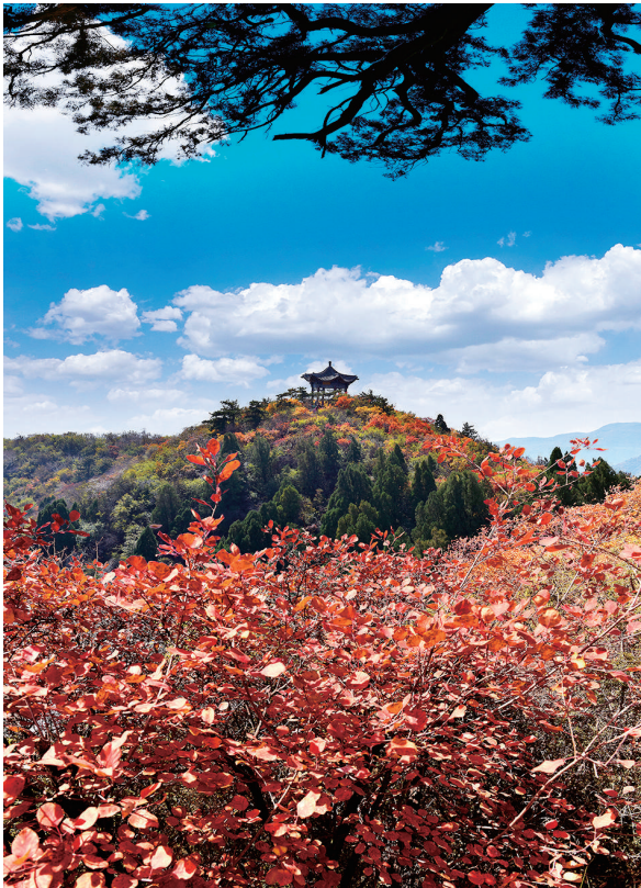
秋到龙山