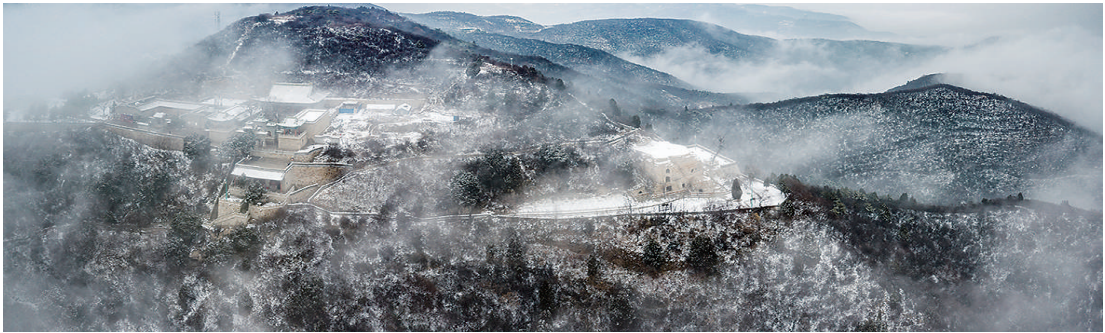
雪后烟雨龙山娇