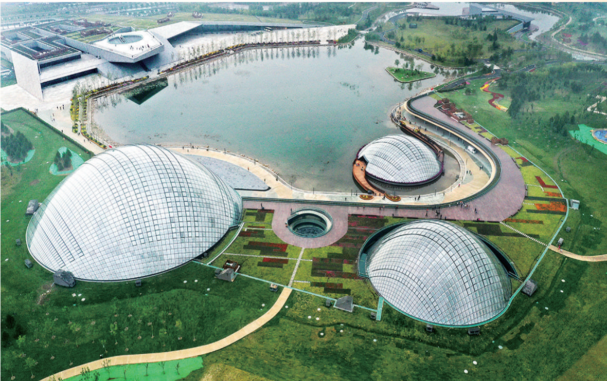
太原植物园是我市首个生态植物园,集园艺观赏、科普教育、科学研究于一体。

医”成果惠及人民群众。新冠肺炎疫情防控取得重大战略成果,人民生命安全和身体健康得到可靠保障。