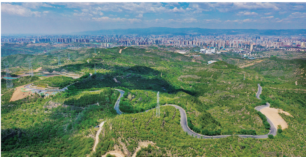
东山旅游公路。一条公路串联龙城美景。

“十三五”时期,是我市发展极不平凡的五年。习近平总书记先后两次亲临山西视察、深入太原调研,发表重要讲话、作出重要指示,为太原发展指明了前进方向。