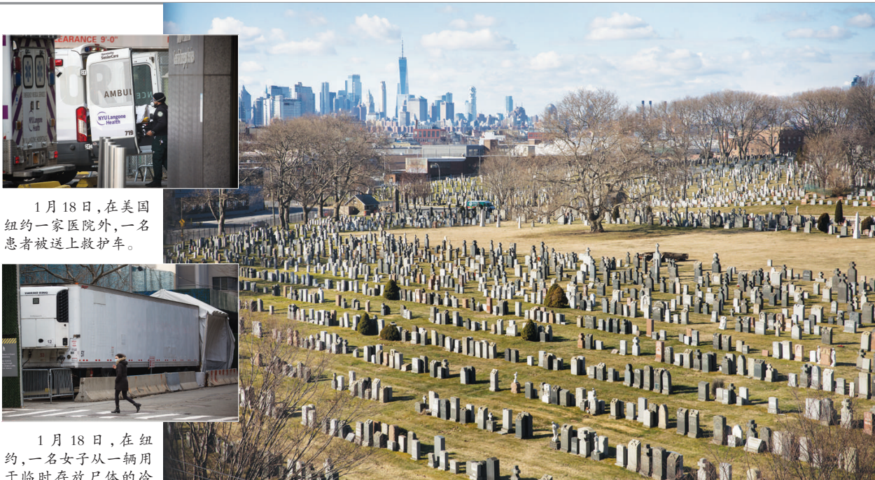
1月18日,在美国纽约一家医院外,一名患者被送上救护车。