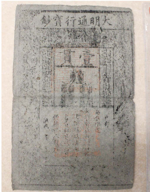
大明通行宝钞。