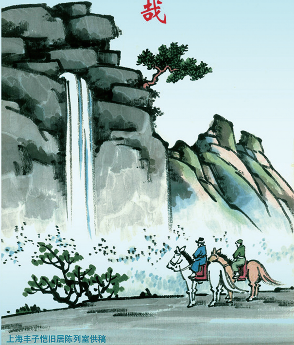
上海丰子恺旧居陈列室供稿