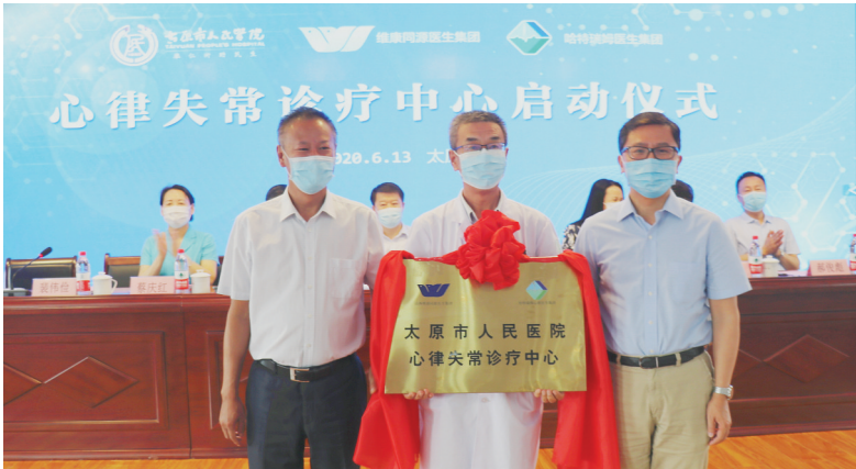
太原市人民医院心律失常诊疗中心成立

功以才成，业由才广。人才是最核心的竞争力。太原市人民医院以“不求所有，但求所用”的开放人才观，吸引各路“英才”纷至沓来：23个名医工作室，37名上海、北京、浙江、深圳的专家团队，让市人民医院成了三晋百姓“家门口的名医站”。 2020年6月13日，依托哈特瑞姆&维康同源医生集团的刘兴鹏教授心律失常团队，“太原市人民医院心律失常诊疗中心”正式成立。诊疗中心启动以来，心律失常专家团队从互联网问诊、手术演示、人员培训、病例书写到周边患者转诊，处处体现了“以患者为中心”的服务理念，让医疗有了温度。