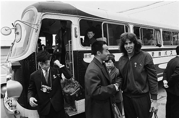
1971年4月，第31届世界乒乓球锦标赛期间，庄则栋（左）与美国乒乓球队选手格伦·科恩（右）握手交谈。