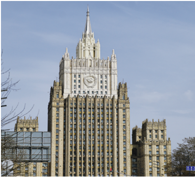
4 月 16 日在俄罗斯首都莫斯科拍摄的俄罗斯外交部大楼。 新华社 发