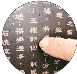
碑文中的“干”,在注释中变成“幹”