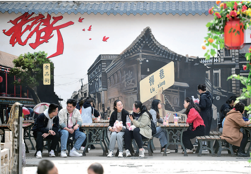
5月5日,食品街游人如织,欢声笑语不断,充满了浓浓的节日氛围。小长假期间,品尝各种特色小吃、晋式传统糕点,欣赏太原莲花落成为不少市民的选择。

临时保管,但也有少数人会把车子藏起来或留着供个人使用,管理员找上门就索要保管费、好处费等。 太原公交公共自行车公司二车队负责人呼吁,公共自行车属于公共财物,希望租车人能妥善保管,市民“捡”到公车后应立即交还,如确因保管“公车”有支出,可以与最后租车人协商解决问题。