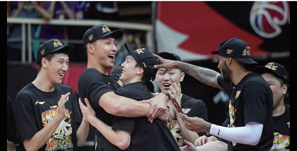
广东队球员庆祝夺冠。

以我们不去想结果,要踏踏实实做好每一天。” 就连郎平自己,近段时间也在进行一些肌肉力量训练,因为奥运会球队名额有限制,不能让所有陪打教练都去东京,届时郎平还需亲自给队员陪打抛球。 正如郎平所说,东京奥运会将是一场混战和恶战”。因此球队更需要抓住不多的实战机会找到状态,避免在奥运会上出现“慢热”问题。 对于球员们来说,东京奥运会前的比赛实战,也是争取入选奥运名单的最重要机会。每个人必须拿出最好状态,才能得到郎平的信任。 据澎湃新闻