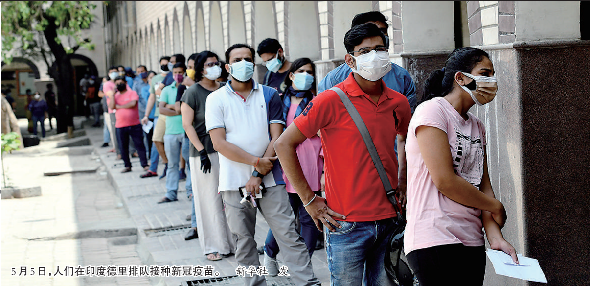
5月5日,人们在印度德里排队接种新冠疫苗。