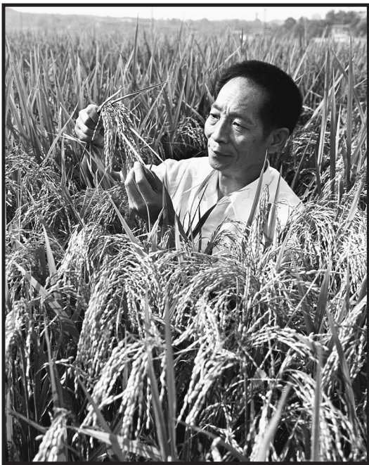
这是1981年,袁隆平为第二届国际杂交水稻育种培训班遴选讲课用的杂交水稻标本。

今年4月,同袁老共事了13年的李建武,在社交平台上发布了一条两人历年合影的短视频,点赞量超过40万。李建武写道:“跟袁隆平院士一起的杂交水稻之路,少年,加油!”