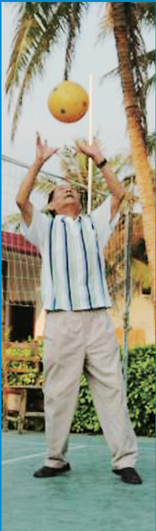
2006年,袁隆平打气排球。