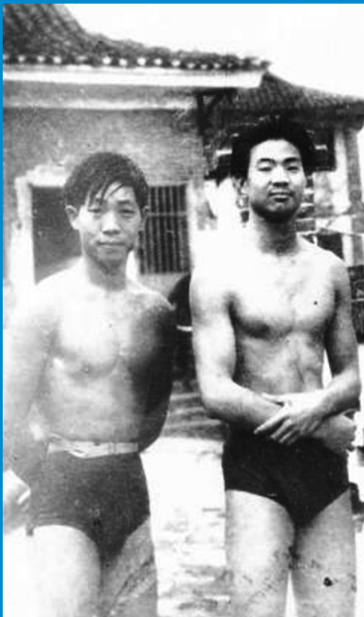
学生时代的袁隆平(左)酷爱游泳。