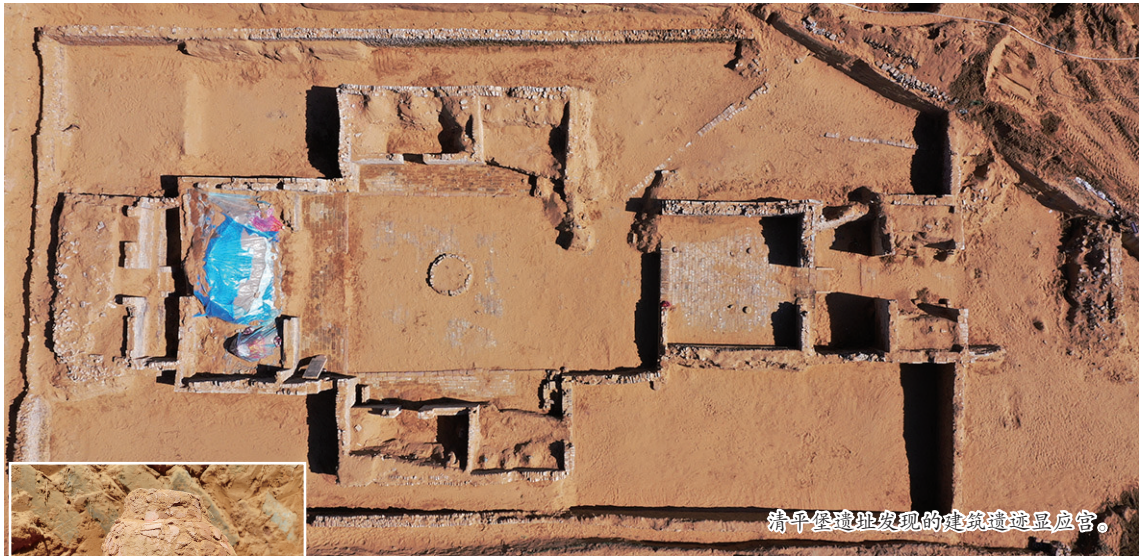
清平堡遗址发现的建筑遗址显应宫。

北京保利拍卖中国古董珍玩艺术总监李移舟认为，以今年保利春拍市场表现来看，藏家对于购买每个门类顶尖的精品还是有很高热情的。 宋宇晟 董泽宇