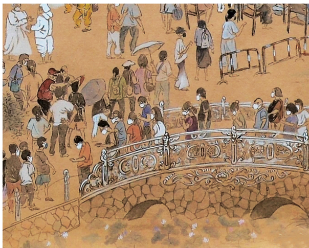
市民群众戴着口罩在有序排队