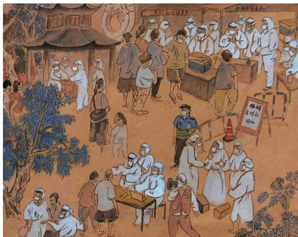
人民警察在现场维持秩序