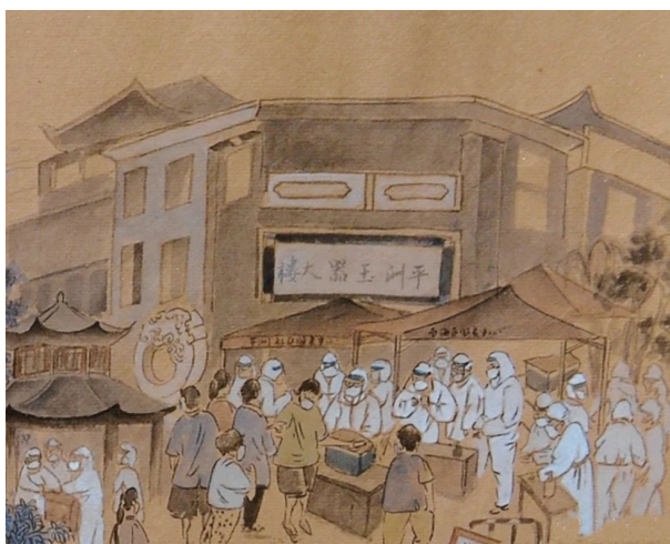
佛山地标平洲玉器街前的核酸采样现场