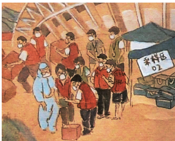
志愿者紧张忙碌的身影